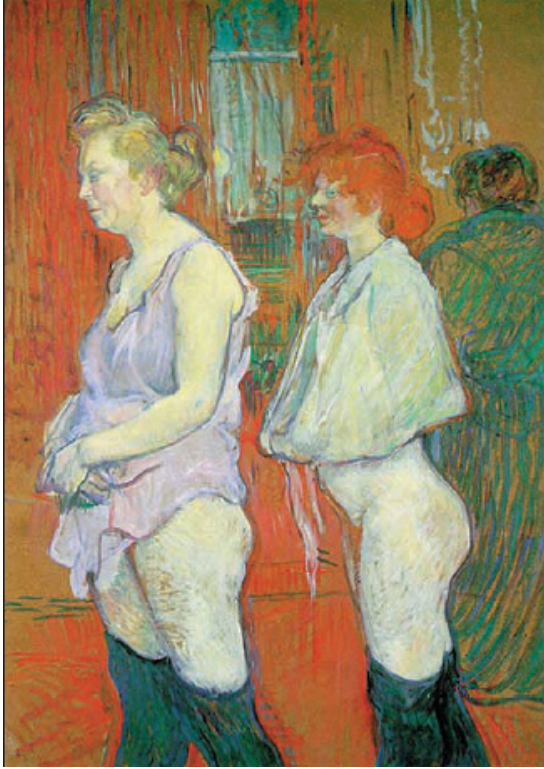
Sağlık Kontrolü, Rue des Moulins (1894) Henri Toulouse-Lautrec

taraflları fuhuş sektörüne yeniden kısıtlamalar getirmeyi istemekte ve fuhuş sektöründe yeni kısıtlayıcı düzenlemeler gündeme gelmektedir.